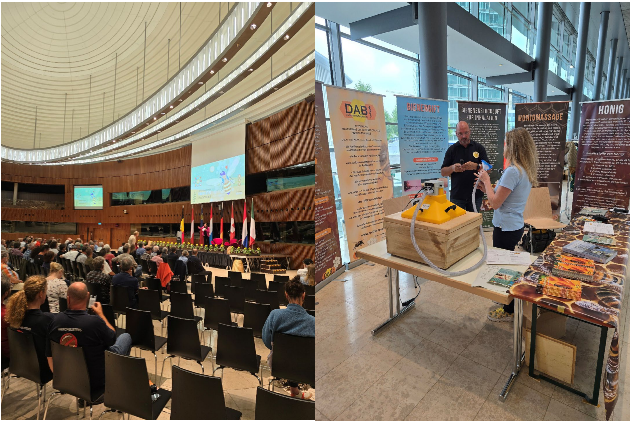
Der DAB auf dem 92. deutschsprachigen Imkerkongress in Luxemburg